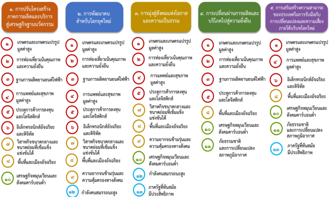
แผนภาพที่ ๓.๑ ความเชื่อมโยงระหว่างหมวดหมู่การพัฒนา กับเป้าหมายหลัก

ความเชื่อมโยงระหว่างหมวดหมู่การพัฒนา กับเป้าหมายหลักแสดงไว้ในแผนภาพที่ ๓.๑ โดยหมวดหมู่การพัฒนาที่กำหนดขึ้นเป็นประเด็นที่มีลักษณะเชิงบูรณาการที่ครอบคลุมการพัฒนาตั้งแต่ในระดับต้นน้ำจนถึงปลายน้ำ และสามารถนำไปสู่ผลพัฒนาทั้งในมิติเศรษฐกิจ สังคม ทรัพยากรธรรมชาติและสิ่งแวดล้อมไปพร้อมๆ กัน ทำให้หมวดหมู่แต่ละประการสามารถสนับสนุนเป้าหมายหลักได้มากกว่าหนึ่งข้อ นอกจากนี้การพัฒนาภายใต้แต่ละหมวดหมู่ ไม่ได้แยกขาดจากกัน แต่มีการสนับสนุนหรือเอื้อประโยชน์ซึ่งกันและกัน